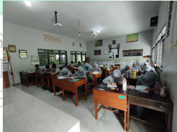
الاختبار التحريري الصف عادي