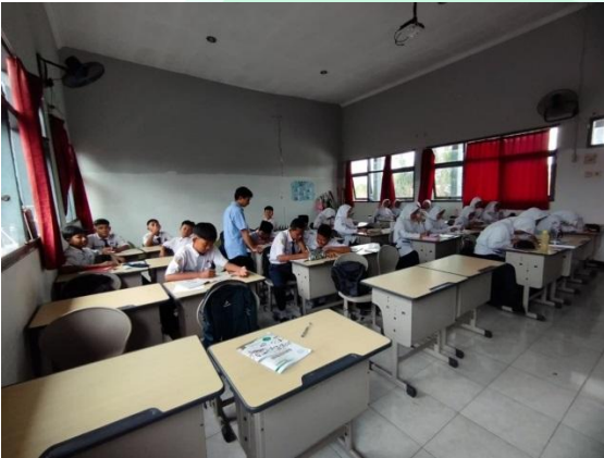
الاختبار التحريري الصف عادي