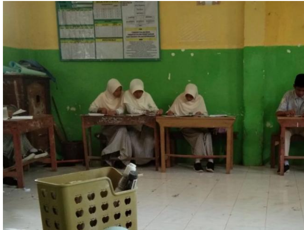
Gambar 4.4 Peserta didik sedang diskusi 109