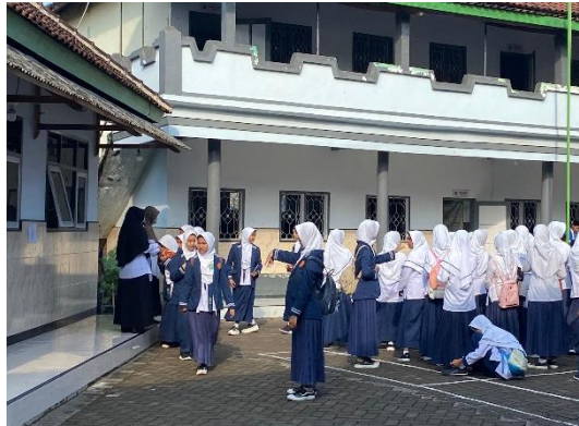
Gambar 4.2 Peserta didik mengantri ketika mushofahah 82