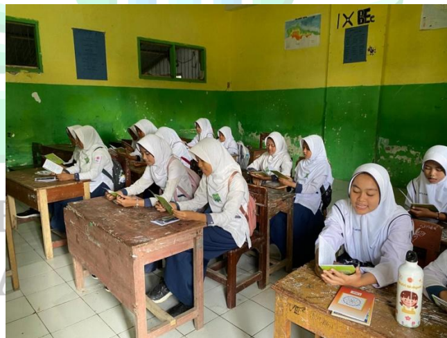
Gambar 4.3 Kegiatan peserta didik TPQ 95

“Kegiatan TPQ disini sudah disesuaikan dengan kemampuan mereka ketika tes. Namun tidak menutup kemungkinan ada beberapa peserta didik yang masih keliru dalam membaca Al-Qur’annya, sehingga ketika mereka bergantian baca Al-Qur’an dan temannya ada yang salah bacaan, mereka bantu mengoreksi bacaannya.” 94