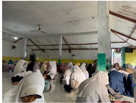
Gambar 4.1 Kegiatan istighosah, kemudian dilanjut dengan sholat dhuha 74

positif terhadap sikap mereka dalam proses pembelajaran maupun kehidupan sehari-hari. 73