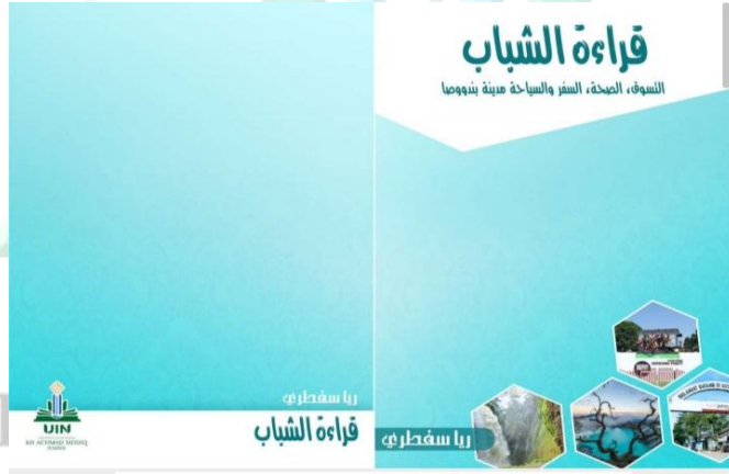
١ الصورة غلاف تطوير مادة القراءة على أساس الثقافة المحلية

ظهرت مواصفات الإنتاج من تطوير مادة القراءة على أساس الثقافة المحلية فيه مادة عن ما يتعلق بثقافة المحلية مدينة بندووصا عند المواضع القراءة المعينة ويناسب على كتاب المقرر لدى الطلبة الذي تم نشرها من قبل وزارة الدينية. تتكون تطوير مادة القراءة على أساس الثقافة المحلية كمايلي : أ. غلاف