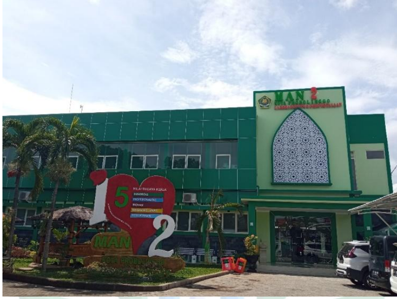
بناء مدرسة الثانوية الإسلامية الحكومية الثانية بفربولنجوا