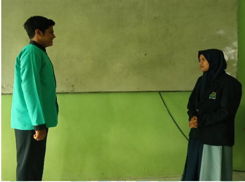
المقابلة الشخصية مع طالب