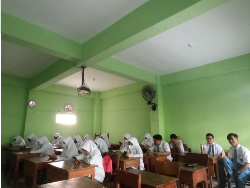
الملاحظة في الفصل الحادى عشر قسم الدين