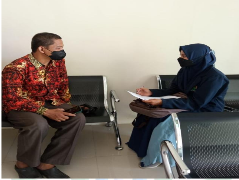
المقابلة الشخصية مع ولي الفصل الحادى عشر