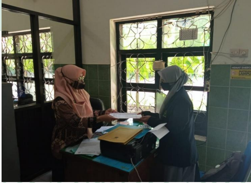
إعطاء الرسالة البحث العلمي