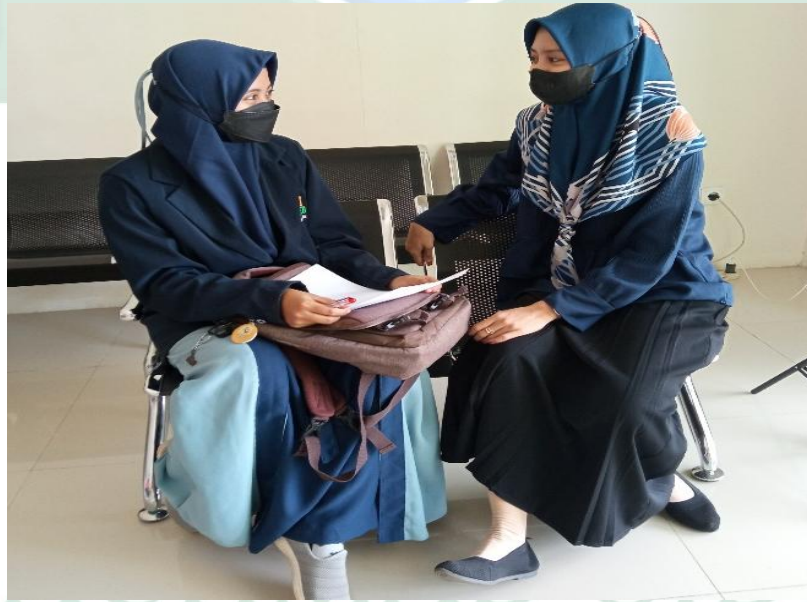
المقابلة الشخصية مع مدرسة اللغة العربية